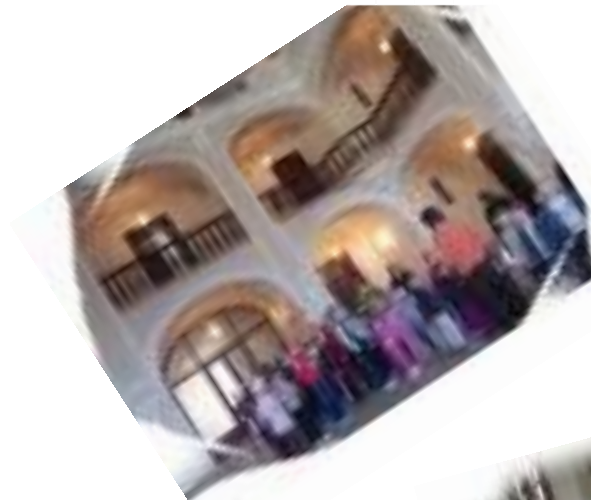
- LA BISERICA