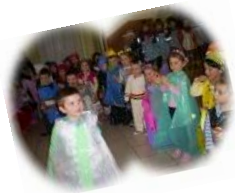
-PARADA COSTUMELOR ECOLOGICE