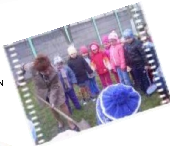
- PLANTAM UN COPACEL