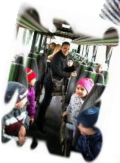
- PE MICROBUS