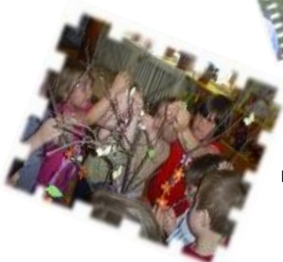
- DECORAM UN COPACEL CU FLORI SI FRUNZE